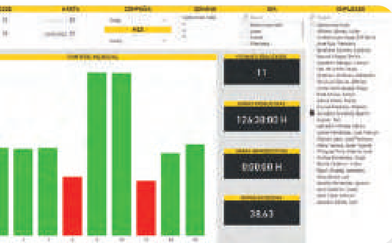
Control de fichajes

Moderniza la inteligencia de negocio y obtén una visión integral y sencilla de los datos de tu organización. Toma decisiones mejor informadas explotando los datos almacenados en el sistema a través de informes y visualizaciones gráficas. Impulsa mejoras en tu organización, anticipa a eventuales problemas detectando ineficiencias lo antes posible y adáptate a los cambios de contexto con rapidez.