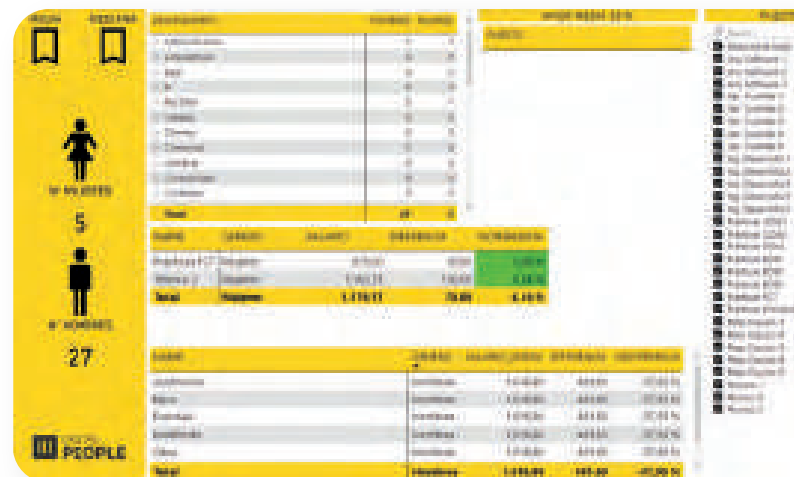
Informe de igualdad

Elimina el papel y digitaliza tus procesos